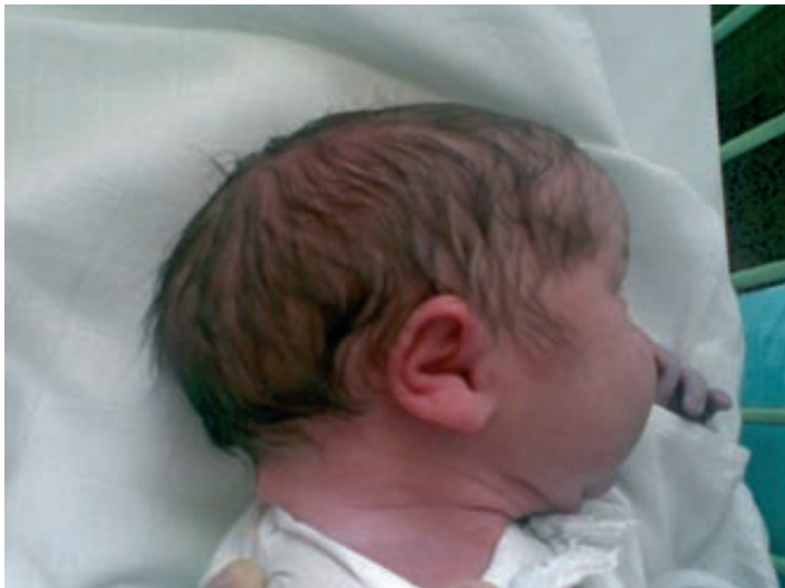
Obr. 2. „Breech Head“ – patrný protáhlý tvar hlavičky s prominujícím záhlavím a subokcipitálním oploštěním. Naznačená aurikulární deformace je pravděpodobně způsobena kraniálním tlakem raménka intrauterinně.

Termínem „breech head“ označili kraniální deformaci poprvé Haberkern et al [1], čímž poukázali na nejčastější společný prvek v etiologii. U plodů v poloze podélné koncem pánevním je v pozdním těhotenství hlavička často v retroflexi a ke zřetelné deformaci lebky dochází pravděpodobně tlakem fundu děložního na rostoucí kranium. K dalším predisponujícím faktorům patří také velikost plodu v termínu porodu, primiparita a oligo-