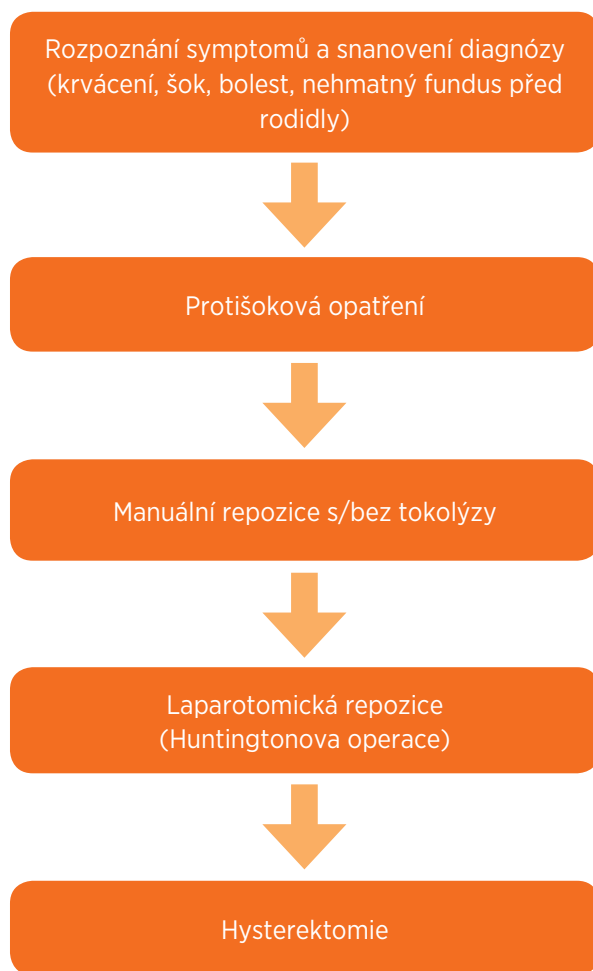
Obr. 3 Management inverze dělohy

překotný porod, konstituční faktory (poruchy pojiva, astenický habitus, hypoplazie dělohy), zvýšení nitrobřišního tlaku (mikce, tlak na fundus u nekontrahované dělohy), nekontrolovaný tah za pupečník a další (tab. 2) [2]. Z uvedených rizikových faktorů jsme u naší pacientky zaznamenali primiparitu a placentu adherens.